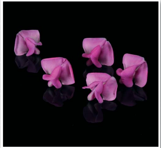
Bean Blossom ( Dolichos )

Bean Blossom ist die Blüte eines auf verschiedene Weise verwendeten Hülsenfrüchtlers und gleichzeitig eines der ältesten gezüchteten Gewächse. Es handelt sich um ein Gewächs, das in Indien seit jeher angebaut wird. Die jungen, noch nicht ausgewachsenen Schoten werden gekocht und wie grüne Bohnen gegessen. Die jungen Blätter kommen roh in Salate, während die ausgewachsenen Blätter gekocht wie Spinat gegessen werden. Die Blüten isst man roh oder gedämpft.